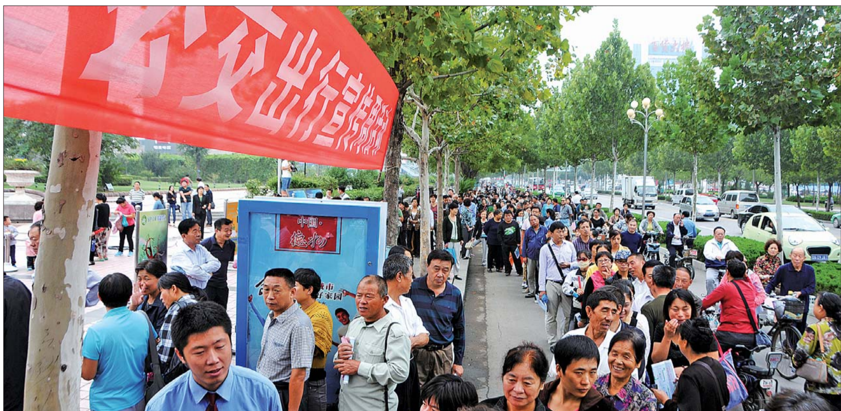
9月22日,公交卡充值优惠,德州中心广场办理点前排起长队。