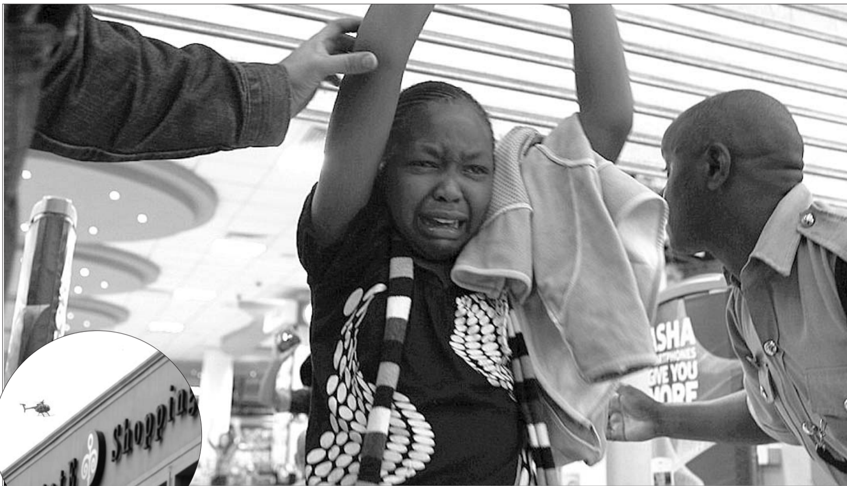
▲21日,一架军用直升机盘旋在西门购物中心上方。