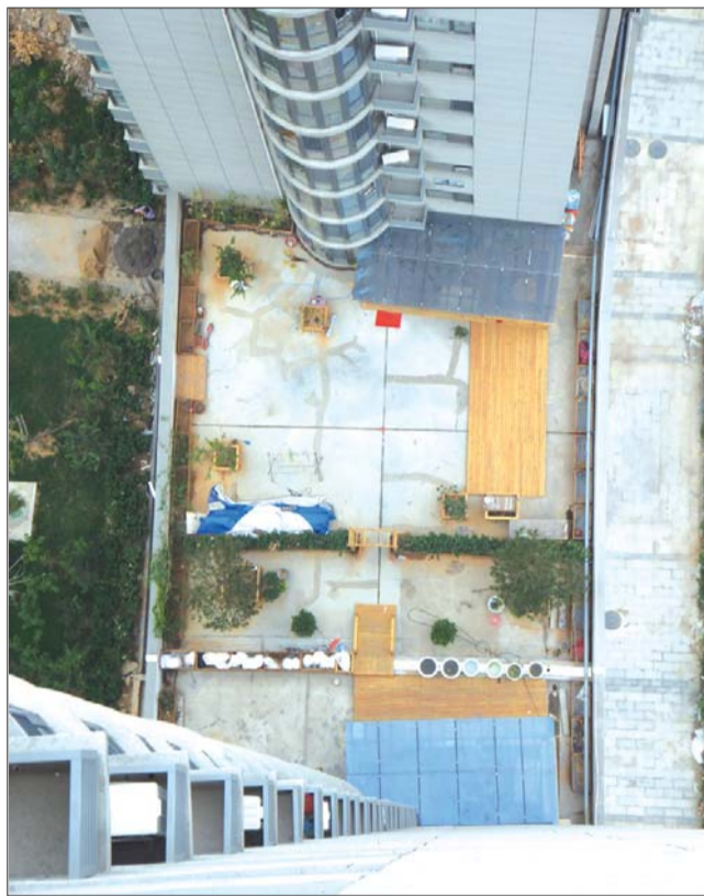
房顶“花园”,建有两个木棚。

小区物业工作人员说,他们多次找过两家业主,但都拒绝拆掉搭的棚子。“我们只能帮着协商,也贴了整改通知。业主不拆,我们也没办法。”