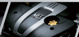
Start-Stop智能启停节能系统