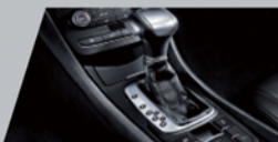
TST 6速油冷双离合自动变速器