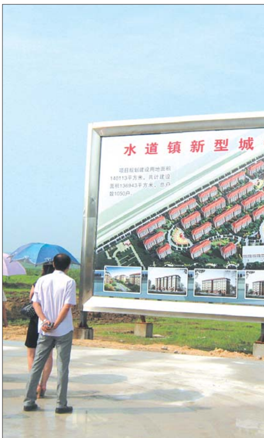
由镇里上市企业恒邦集团投资兴建的小区已经开始动工。