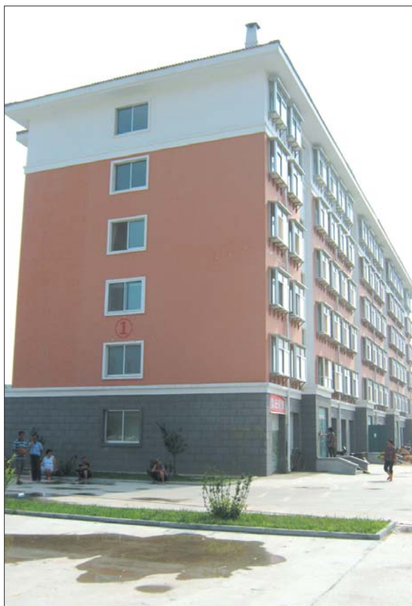
政府直接出资建设的西直格庄社区。村民们已经搬进了宽敞明亮的楼房。