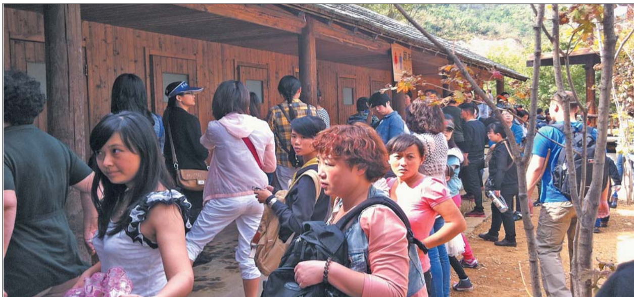
景区内上厕所排队成了一景。

“杜康泉边的泉水直饮点取的是趵突泉水,所以增加取水点很复杂。”趵突泉景区工作人员聂晶告诉记者,国庆假期回来取水的主要是外地游客,本地游客大都在黑虎泉边取水,而且在五龙潭也有取水点,游客可到这两个取水点灌泉水。“景区很难按照国庆假期的游客数量配置所有服务设施,这样成本较高。”