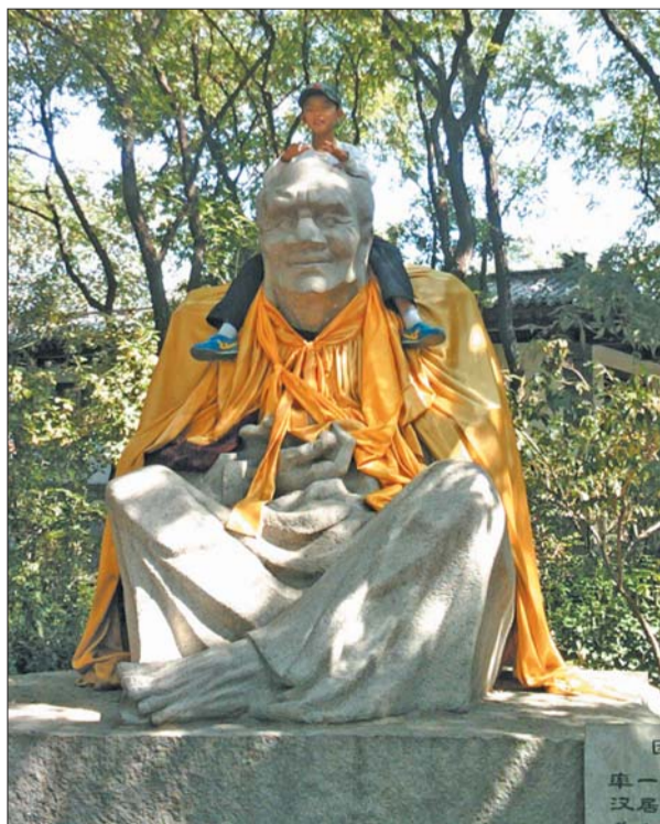
在千佛山景区,一少年骑在罗汉脖子上让妈妈拍照。

山大管理学院旅游管理系主任王德刚教授称,随手扔垃圾、爬树折枝等不文明行为尚属道德范畴,还没有明确的法律条文规定,只能靠景区加强管理和游客自律来解决。