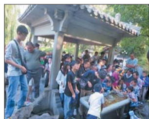
游客在杜康泉边排队灌泉水。