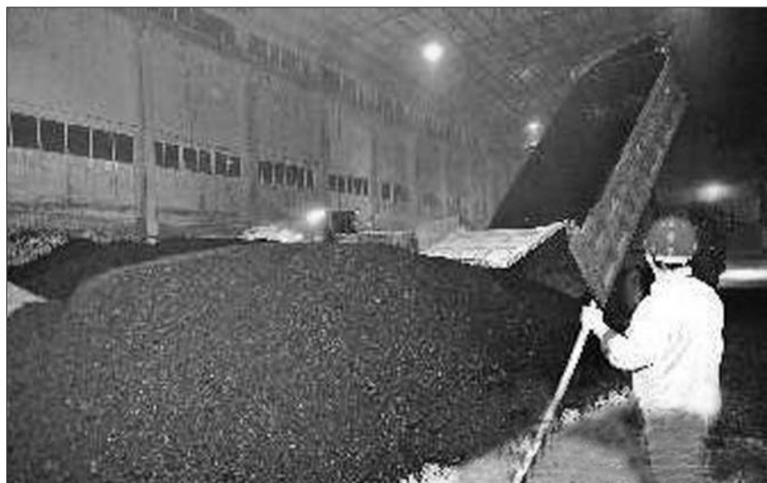
今年煤炭价格大幅下降,供暖企业成本压力大减。(资料片)

烟台物价局工作人员表示,虽然煤价有所下降,但其他成本上涨了很多,比如人工费、运费等。此外,环保压力加大,热企锅炉需要进行改造,也导致成本有所增加。