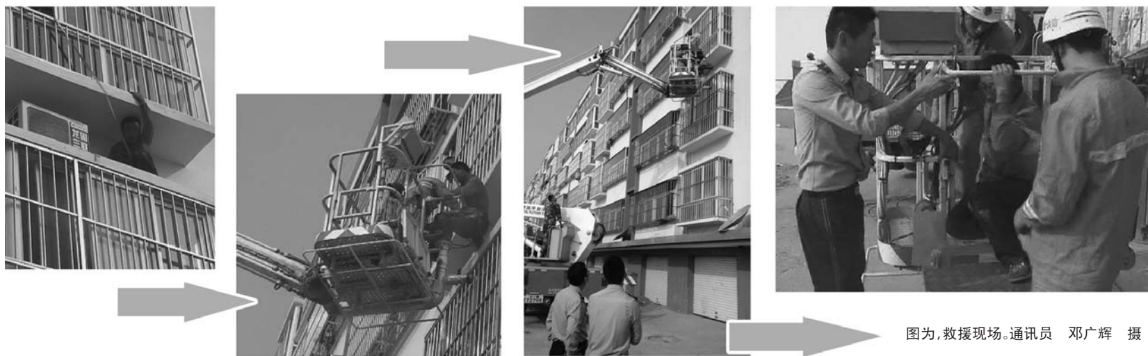
图为,救援现场。通讯员 邓广辉 摄

民警提醒市民,如遇钥匙被锁家中等类似事件发生,切不可盲目翻窗,可迅速报警或向开锁公司寻求帮助。