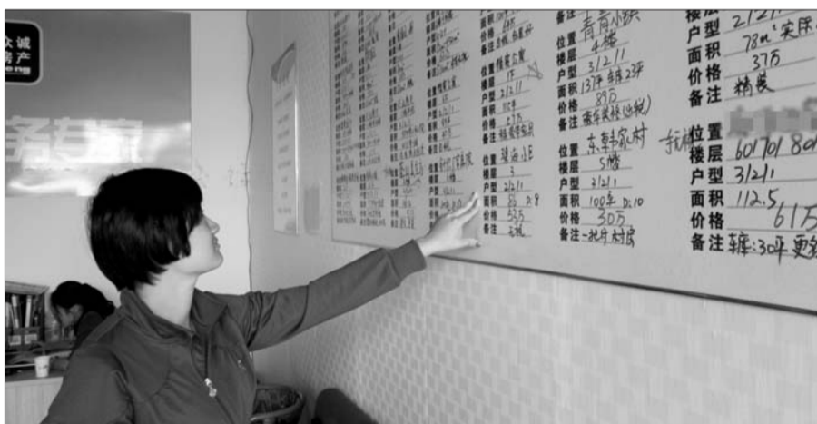
8日,开发区一家中介的置业顾问介绍房源情况。

“十一”长假悄然结束,8日,记者走访市区多家二手房中介了解到,长假期间,咨询的客户较多,但成交率很低。“这个金九银十对开发商而言是货真价实的,对二手房而言几乎没啥意义。”一位二手房中介负责人无奈地说。