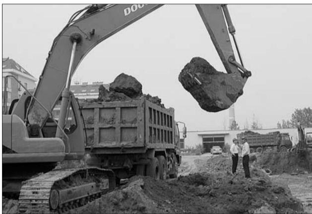
8日,长信书香河畔项目正在紧锣密鼓地施工。