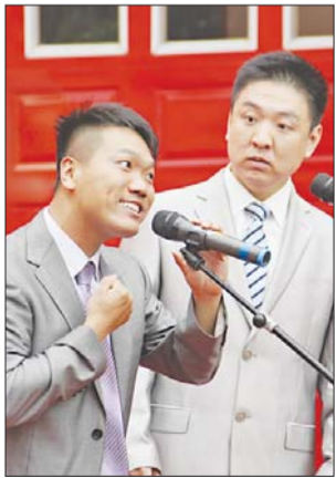
曲艺数来宝《登陆上海滩》。

创作方面,我省广泛动员全省优秀创作力量,组织专家现场指导,反复加工提高,目前全省有39件作品进入第十届中国艺术节“群星奖”决赛,数量居全国首位。山东省入选群星奖决赛的作品有平派鼓吹乐《赶山会》,表演唱《泰山石敢当》,群舞《田野的健儿》,群舞《闯关东》,儿童剧《我们的名字》,小品《新房之夜》,山东快书《肉夹馍》,山东琴书《亲家亲》,山东琴书《闹喜宴》等。