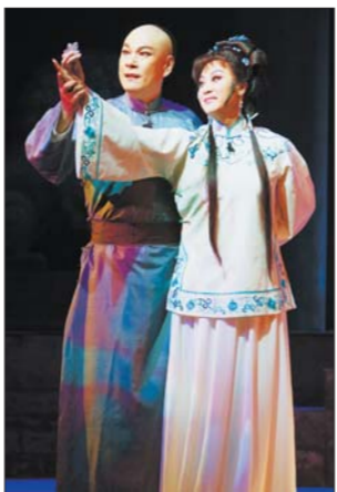
京剧《瑞蚨祥》中的孟洛川和容玉蜓。

自取得十艺节筹办权以来,我省大力实施舞台艺术精品工程。全省各地为十艺节创作了62台新剧目,大部分地市的艺术创作达到了历史最高水平,许多剧目已成为当