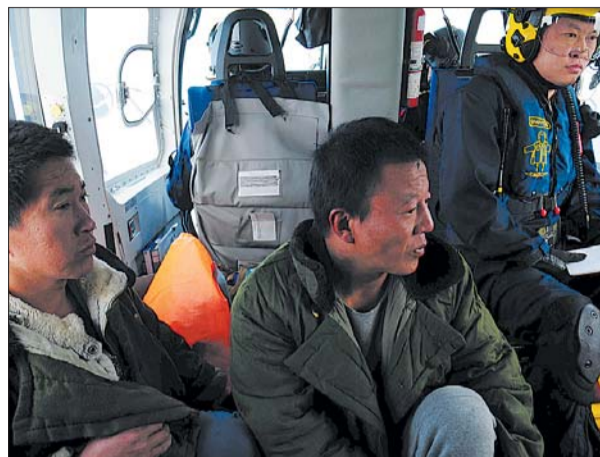
北海第一救助飞行队救助直升机将2名获救渔民转送至蓬莱机场。

据介绍,“新海顺”轮长135米,宽21米,本航次满载货物11959吨,由黄骅开往芜湖。目前,烟台海事局已责令该轮驶往龙口港接受海事调查,处理善后事宜。