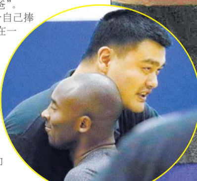
科比、姚明热情拥抱。

同前来给自己捧场的科比,站在一群残疾儿童中间游戏,姚明似乎又找到了篮球激情燃烧的岁月,尽管身形早已发福。时光在变,两位巨星带给中国的篮球情愫,却依旧在流淌。