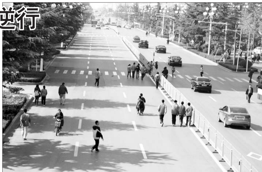
部分学生在机动车道逆行。

育才中学政教处的负责人解释称,学校一直很关注学生的出行安全问题,也做过很多努力,但由于学生出行习惯和家庭住址等原因,这种现象一时难以根治。今后,学校将继续加强对学生安全出行的教育,帮助学生养成良好的出行习惯。