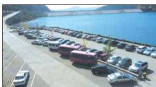
“十一”期间,招虎山九龙湖边的停车场内停满自驾车。(资料图)

据国家统计局烟台调查队发布的《2012年烟台市国民经济和社会发展统计公报》显示,烟台市城市每百户居民家庭汽车拥有量从2011年的27.5辆增加到37辆,同比增长34.5%,省内排名仅次于东营。据了解,2012年年末,烟台市民用汽车拥有量达到96.67万辆,比上年增长11.3%,其中当年新注册13.11万辆,增长2.8%。2012年年末,家庭汽车保有量83.71万辆,增长12.6%;家庭轿车保有量为45.96万辆,增长21.7%,其中当年新注册7.88万辆。