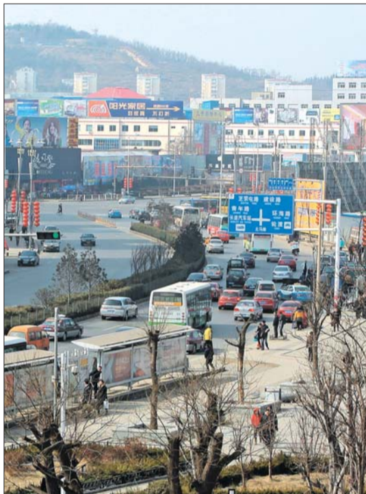
每逢节庆,总有私家车大军涌入烟台繁华路段。(资料图)

据国家统计局烟台调查队发布的《2012年烟台市国民经济和社会发展统计公报》显示,烟台市城市每百户居民家庭汽车拥有量从2011年的27.5辆增加到37辆,同比增长34.5%,省内排名仅次于东营。据了解,2012年年末,烟台市民用汽车拥有量达到96.67万辆,比上年增长11.3%,其中当年新注册13.11万辆,增长2.8%。2012年年末,家庭汽车保有量83.71万辆,增长12.6%;家庭轿车保有量为45.96万辆,增长21.7%,其中当年新注册7.88万辆。