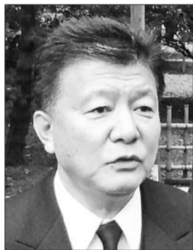
总务大臣 新藤义孝