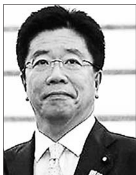
内阁官房副长官 加藤胜信