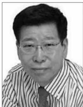
首相辅佐官 卫藤晟一