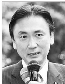
国家公安委员长 古屋圭司