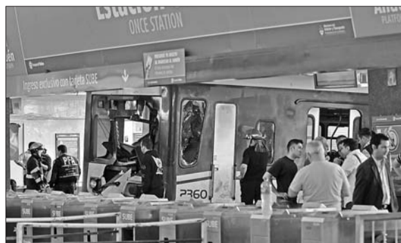
19日,警察和消防员在城铁事故现场忙碌。

乏维护,设备严重老化。今年年初,政府投资10亿美元更新萨维托托线和米特雷城铁系统,这是阿根廷近60年来规模最大的城铁投资项目。