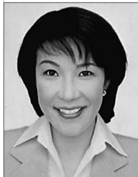
自民党政调会长 高市早苗