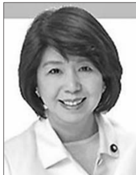
文部科学副大臣 西川京子