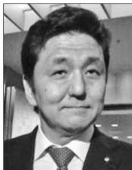
外务副大臣 安倍岸信夫