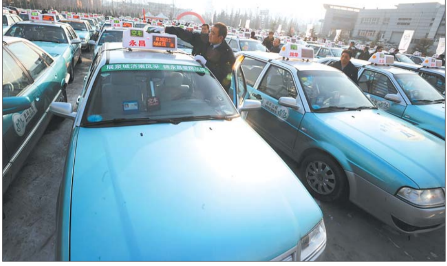
新出租车也都换上了新式顶灯(资料片)。

电话:96706 邮箱:qlwbjzx@163.com QQ群:107866225