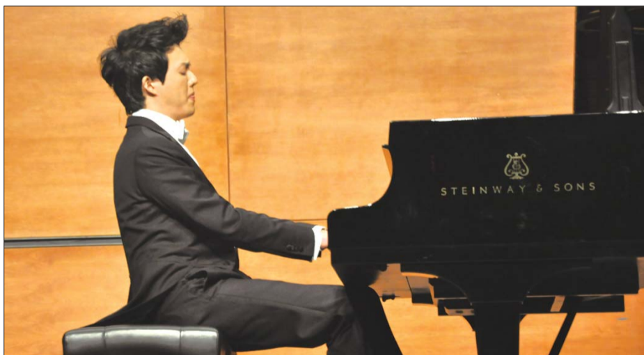
10月27日,“钢琴王子”李云迪将携“中国钢琴梦”来烟。

10月27日,“钢琴王子”李云迪携“中国钢琴梦”为烟台的观众献上了一场恢宏唯美的音乐盛宴;11月2-3日,具有美国一级交响乐团之称的美国圣地亚哥交响乐团将组织四管编制120多人的庞大阵容来烟首演,这将是烟台音乐会现场规模空前的一场古典艺术盛宴。