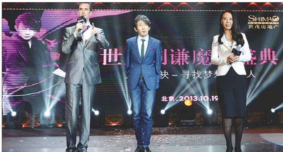
“谦手世茂,寻找梦想合伙人”大型魔幻秀现场

10月19日,世茂集团“谦手世茂,寻找梦想合伙人”大型魔幻秀在北京国际饭店上演。来自全国百家媒体代表与世茂环渤海区域逾千名业主、客户齐聚一堂,欣赏著名华人魔术师刘谦献上的精彩表演。作为世茂整合“软性价值资源”的一项重要内容,北京站成功巡演后,“谦手世茂,寻找梦想合伙人”11站全国巡演完美落幕。