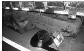
脱离轮轴的轮胎,这下可惹了大祸。

本报10月22日讯(记者 徐艳 通讯员 林勇) 货车高速上行驶中,突然车轱辘脱落了,后方行驶的一辆小轿车被殃,受损严重。说起10月21日晚8点的一幕,菏泽司机师傅王某还心有余悸。