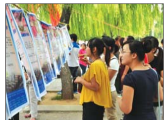
相亲会现场。(资料片)

本报泰安10月22日讯(见习记者 李亚宁) 22日,本报金秋相亲会报名继续进行,截至目前已有300多名单身男女报名。本周五至周日,本报“倾城之SHOW”婚庆行业博览会与金秋乡亲同步进行,市民可到本报编辑部或活动现场报名。