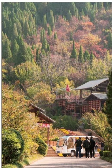
▲拾级而上,景色各有千秋。