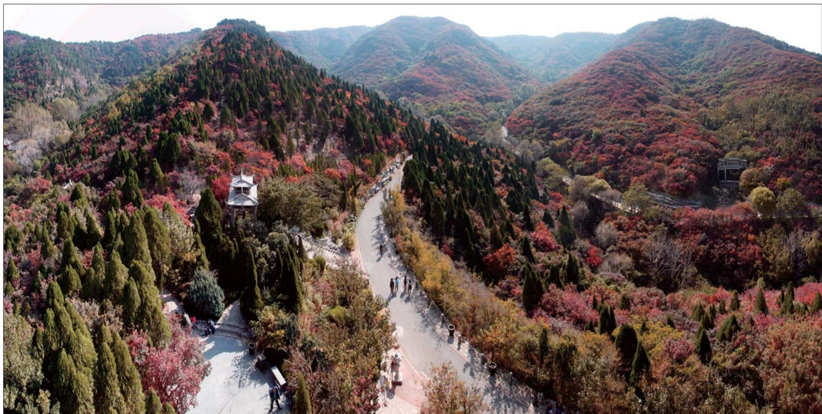
▲层林尽染,秋日的红叶谷美轮美奂,让人陶醉。