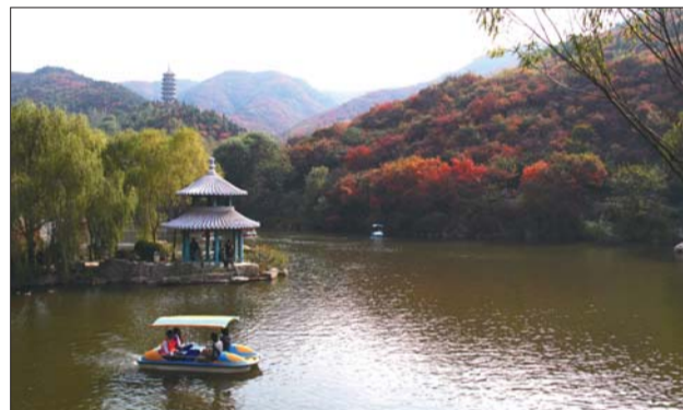
▲泛舟湖上,享山水之乐。

目前,红叶谷景区正在举办第十届红叶节。景区适时增加了专业歌舞表演、CS野战真人对抗、传统面塑手工艺等娱乐项目。