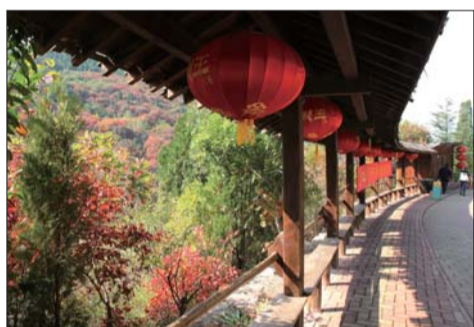
▲典雅的亭台走廊可供游人休憩。