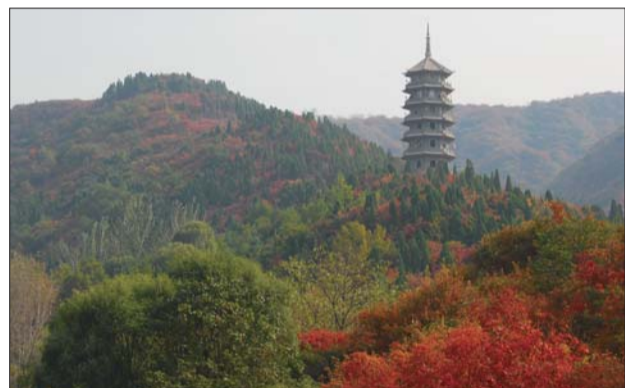
▲山峦叠嶂之间,耸立着一座宝塔。 作者:岳忠东