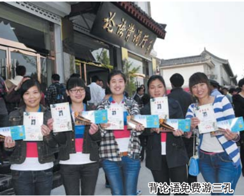
背论语免费游三孔

本着“用标准引领旅游服务业发展、用标准规范旅游服务业业态、用标准提升旅游服务业竞争力”的指导思想，强化体系建设，提升服务标准，规范行业管理，