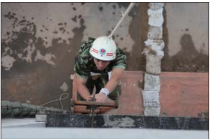
▲一名消防队员参加快速钩梯上楼比赛。