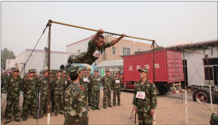
▲消防官兵正在进行单杠套路比赛。