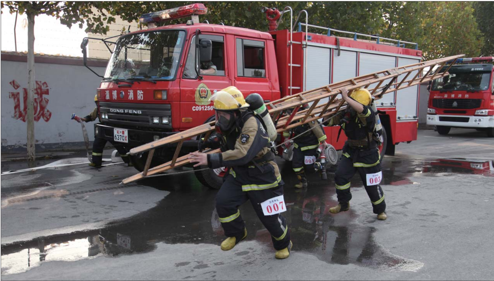
▲消防官兵比赛扛着梯子快速前进。