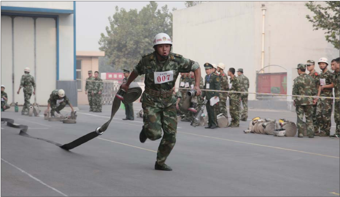
▲消防队员比赛拖着水带奔跑。