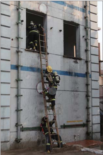
▲官兵齐心协力共同战斗。