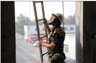
▲一名消防队员正在比赛挂钩梯。

23日,淄博市消防支队17个代表队的136名消防官兵在张店良乡训练基地举行了大比武。 记者了解到,此次比武竞赛紧贴实战,注重实效,共设置了挂钩梯、供水技巧、单双杠套路、一人3盘水带连接、危机救生、多层建筑灭火攻坚操、理论考试等项目。比赛过程中,参赛官兵严守赛场纪律、服从裁判,听从指挥,积极参与、顽强拼搏。 比赛主要从战术、体能、精神面貌三方面来展示消防官兵的实战技能,战术比赛中各中队合理利用规则,结合现场各类情况,科学合理做出人员和战术安排,取得了良好的成绩;体能比赛中,各参赛队员不断挑战自我身体极限,展示了良好的身体素质;参赛官兵克服了比武期间温差变化大等不良影响,全身心投入比赛,以实际行动展现了淄博消防铁军英勇顽强的战斗作风和敢打必胜的精神风貌。