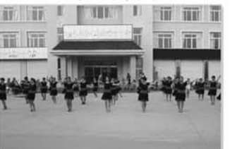
育龄妇女丰富多彩的业余活动