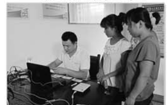
开展育龄妇女健康查体