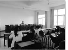
召开计生工作例会