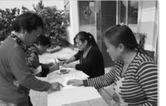
发放计生兑现奖励