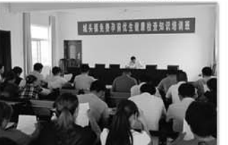
举办孕优生健康知识培训班