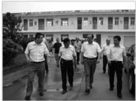
参观企业计生协建设