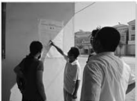
张贴打击两非通告