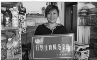
开展 5.29 计生助福行动