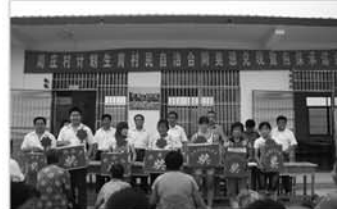
表彰计划生育模范家庭