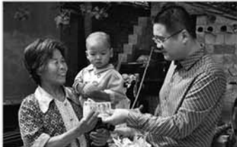
帮扶计生贫困家庭