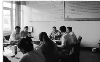
核对计生档薄资料