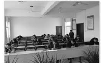
计生包村干部参加考试