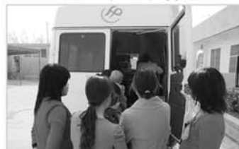
深入企业为育龄妇女健康查体