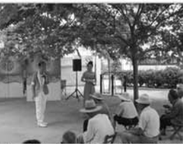
组织文艺宣传队到敬老院演出