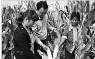
帮助计生户三秋生产