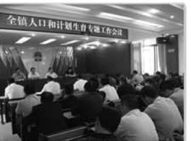
召开计生专题工作会议