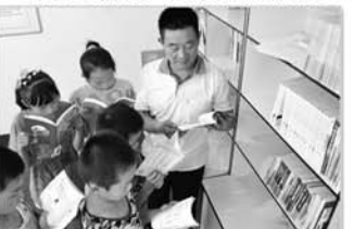
留守儿童计生书屋