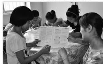
开展留守儿童关爱活动