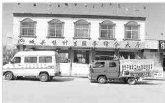
开展计生集中清理清查宣传