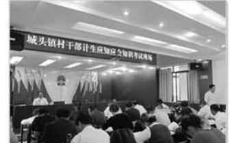
村级干部参加计生考试