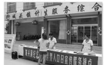
世界人口日集中宣传