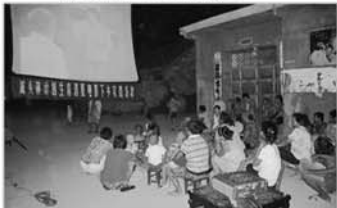
放映计生消夏电影