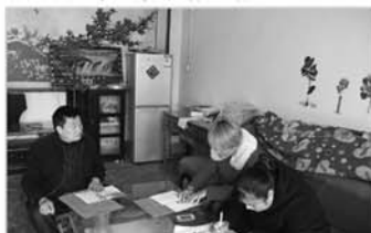
入户宣传计生法律法规