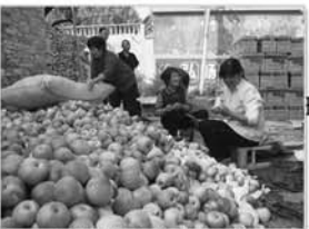
帮扶计生户发家致富