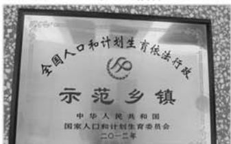
荣获全国计生依法行政示范乡镇