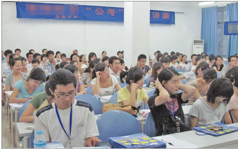
一公考辅导班挤得满满当当。

柳起说起国考,还是有一些无奈,与大多数岗位激烈的竞争相比,许多至今只有两三个人报名的岗位由于诸多限制,对像她这样的应届生来说,只能眼巴巴看着。在这些通过审核的人数可能达不到开考条件的岗位中,多数都有工作经验的要求。