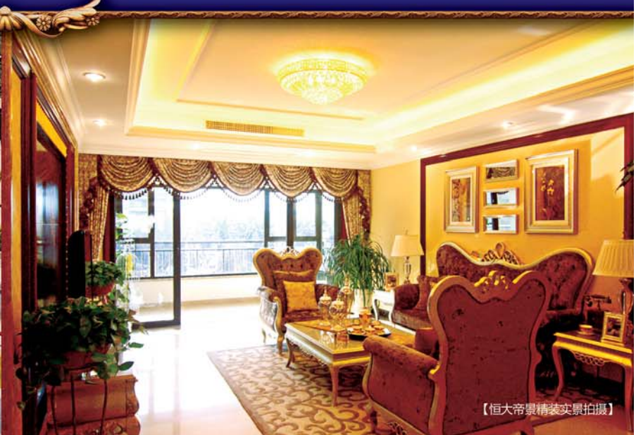
【恒大帝景精装实景拍摄】