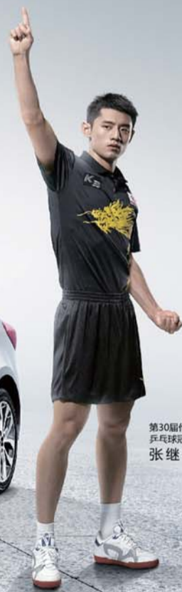
第30届伦敦奥运会 乒乓球冠军 张继科