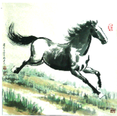
作品:《骏马图》 创作者:王子贤 规格:4平尺 润稿费20000元/平尺

纪念徐悲鸿诞辰120周年,徐悲鸿艺术委员会典藏巨作! 家藏悲鸿真迹,财富无可匹敌!三位嫡传大师升值潜力不可估量,抢到就是财富!