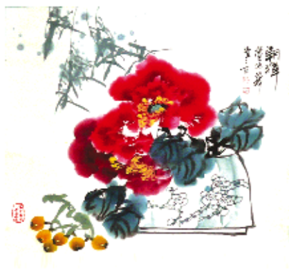
作品:《牡丹图》 创作者:骆盛贵 规格:4平尺 润稿费18000元/平尺