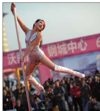
▲惊艳的钢管舞表演把展会气氛推向高潮。