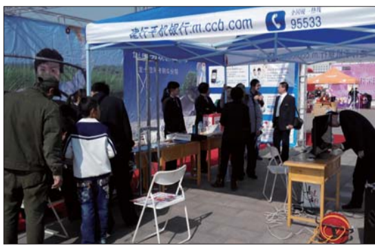
▲中国建设银行莱芜分行参展。

本报10月28日讯(记者 程凌润) 市民分期付款购买吉利等轿车时,使用建行卡是一个不错的选择。26日、27日,本报齐鲁车展上,中国建设银行莱芜分行参展,并推出了分期购