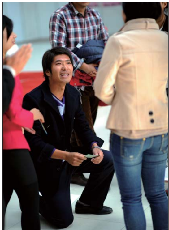
▲男嘉宾赢得女士芳心,单膝跪地现场表白。

记者了解到,在本次“红楼梦酒·相约金秋”牵手成功的男女嘉宾,在结婚当天,还可免费享用由艾米彩妆造型提供的超奢华拖尾礼服一套,高档秀禾装一套,精美礼服一套,奢华肩饰一件,总价值1200元,并享受480元的新娘跟妆一次。