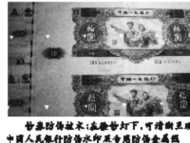
钞券防伪技术:在紫外灯下,可清晰显现中国人民银行防伪水印及专用防伪金属线

抢翻天!专家表示:老版人民币首次以四连体的形式发行,前所未有,如同一座“钱币博物馆”,抢到一套就是财富宝藏!