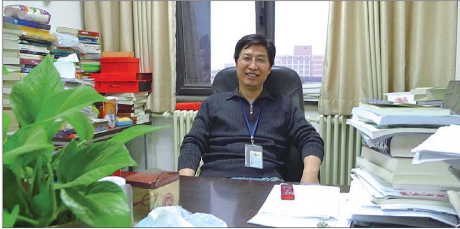
1日,杨光斌接受采访。

杨光斌,河南省桐柏县人。现任中国人民大学比较政治制度研究所所长,兼任政治学系主任,教育部长江学者特聘教授。主要研究方向为政治学理论(制度理论)、当代中国政治、比较政治、中国国内政治经济与对外关系。