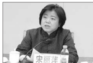
宋丽萍 中央候补委员、深圳证券交易所总经理

今年以来,全国各地纷纷建立区域性市场,已经开业的接近20家,基本形成了覆盖全国的态势。初步统计,8家主要的区域性市场已经累计实现股权融资100亿元,债权融资和股权质押贷款近300亿元,服务中小微企业融资的作用初步显现。