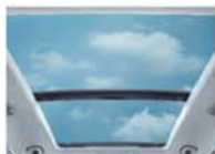
全开式超广角全景天窗