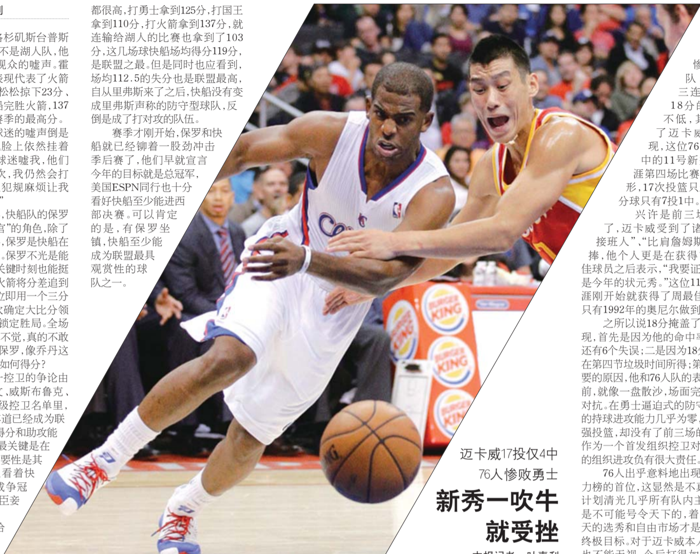
保罗(左)杀气十足。

赛季才刚开始,保罗和快船就已经铆着一股劲冲击季后赛了,他们早就宣言今年的目标就是总冠军,美国ESPN同行也十分看好快船至少能进西部决赛。可以肯定的是,有保罗坐镇,快船至少能成为联盟最具观赏性的球队之一。