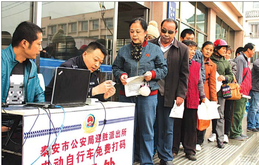
市民排队打码。

销售商销售电动自行车时,应在保修单上登记购买者姓名、身份证号码、车架号、电动机号和联系方式等信息,并告知购买者及时到公安机关实名登记。已实名登记的电动自行车更换电动机、电池的,更换后及时到公安机关办理变更登记,办理时需交验车辆,并提供车辆初次登记时的材料。已实名登记的电动自行车变更车辆所有人的,自变更后及时到公安机关办理转移登记。办理时需交验车辆,并提交原