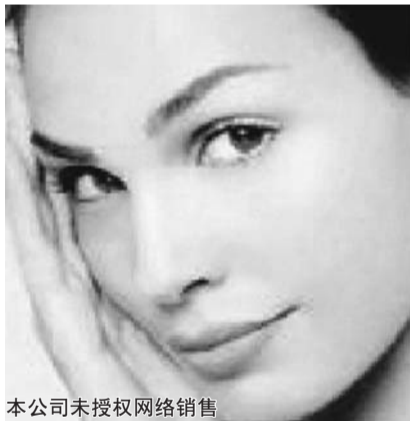
本公司未授权网络销售

据悉脑鸣康已被我市的健康药店(滨医附院对面)独家引进。上市买五送一。具体可拨打服务热线 3998185 详细咨询,全市可免费送货,货到付款。