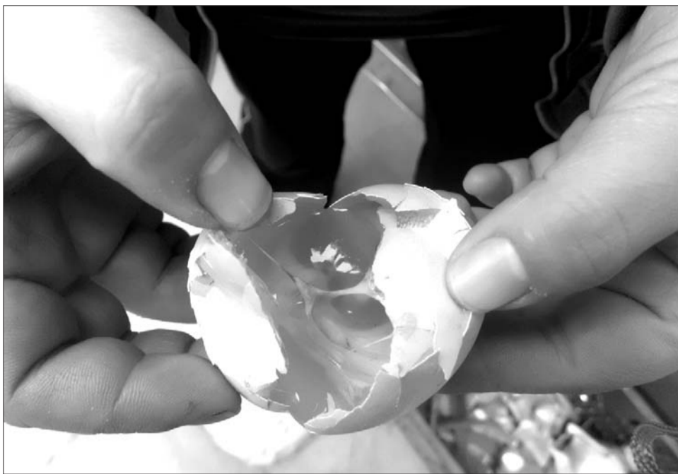
鸡蛋里的蛋清非常浑浊。