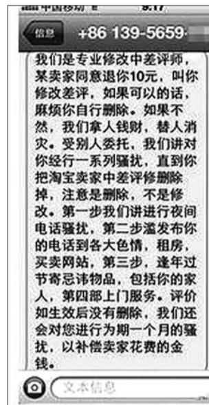
中差评修改师发给消费者的威胁短信。

“可以说没有一家店铺不会收到中差评或者消费者不满意的评价,有些确实是消费者不满,有些则是同行竞争恶意为