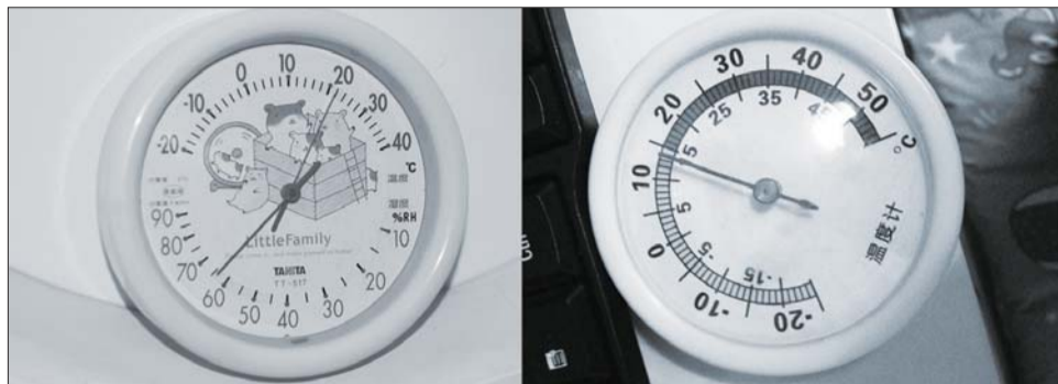
滨海区盐场四区高老先生家中供暖温度达21℃。