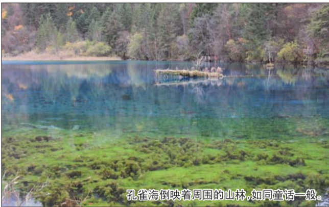
孔雀海倒映着周围的山林,如同童话一般。

十月中旬以后,北方城市的温度开始逐渐下降,空气也变得干燥而寒凉。一直想在这样一个季节给我们一次旅行,目标是南方温暖而潮湿的地方。一开始的计划是去苏州和厦门,清新而精致的城市很适合放松长久以来紧张的心情。但种种原因让我们选择了成都这个当初并未进入候选行列的城市。对于成都知之甚少,喜欢或不喜歡都谈不上,唯一吸引我的只有九寨沟和熊猫。