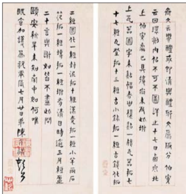
▲董斋致吴平斋书札(部分)