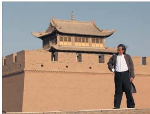
▲二〇一三年春,作者在嘉峪关创作《关河梦断大草五屏》。