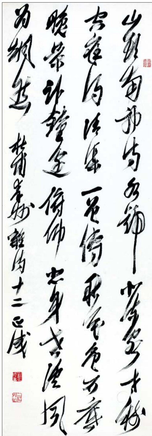
▲杜甫秦州杂诗其十二草书轴 纸本 181cm×64cm

作为书法大家,刘正成先生书法集王羲之、蔡邕、苏东坡和赵孟頫的笔法、笔势、笔画为一体,与自然理致相合,他的理论平息了多年的争论,尤其是他的草书,可谓中国第一巨匠,他从古代书法中顿悟出自然理致,创出了新的书法世界,充满了浩然之气,实现了书法的平衡,堪称书法家的师表。他在中国书法家中的地位如同北极星,有诗赞曰:题刘正成颂“烟云洗出文章净,金石长留日月光。古圣贤从修身起,大英雄自读书堂”。