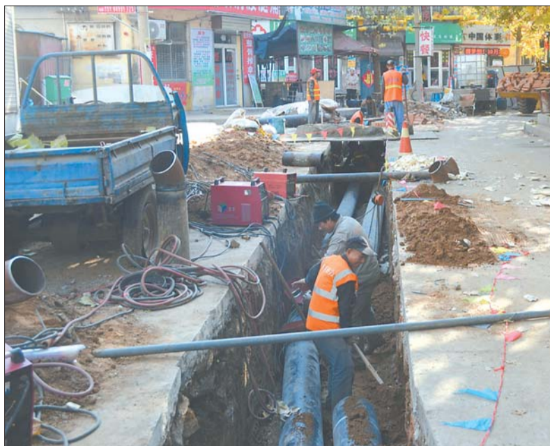
▲七里堡小区南区,施工人员正抓紧施工,保证居民按照协议供暖。

“协调了很多次都不能恢复施工,天越来越冷,老百姓心里都很着急。”吴瑞珩表示,他已经多次找相关部门协调,希望小区居民能够按时通上暖气。