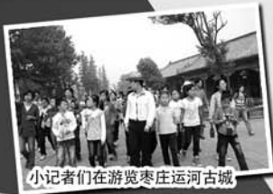
小记者们在游览枣庄运河古城