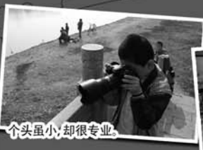
个头虽小,却很专业。