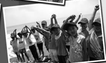
小记者们在日照海滩

好消息!好消息!齐鲁晚报·今日运河编辑部招募 2013 年度校园小记者活动火爆进行中。想让自己的文字带着墨香变成报纸上的铅字吗?想跟随记者现场采访新闻吗?