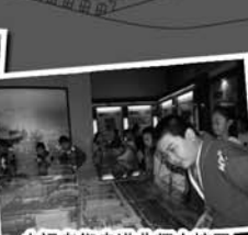
小记者们走进曲阜大学