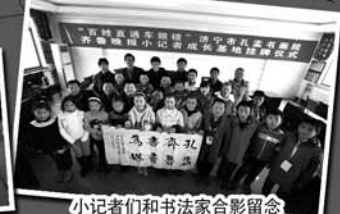
小记者们和书法家合影留念