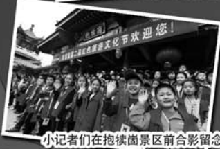
小记者们在抱犊寨景区前合影留念