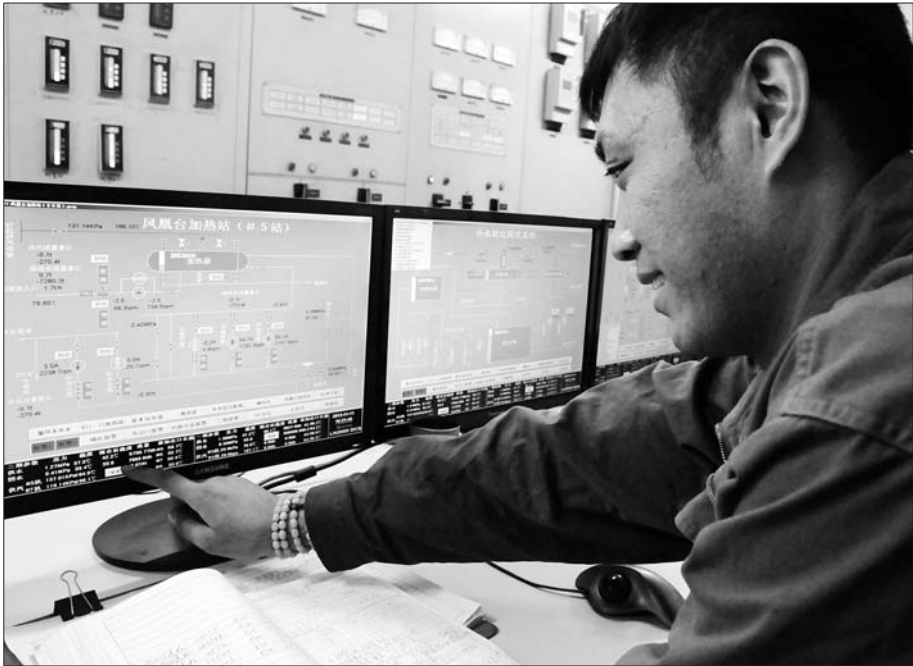
500首站总调度室工作人员24小时值班监测水位和水温。

问暖热线 15264520357 15106456961 本报11月11日讯(记者 孙淑玉) 距离正式供暖还有不足一周的时间,随着气温降低,市区主要供热企业陆续低温调试。11日下午2点,500供热公司开始低温运行,预计14日前后大部分住户家中暖气片就能温乎起来。 为保证供暖质量,11日下午2点,500供热公司开始低温运行。下午4点左右,在500首站调度中心,电脑屏幕上密密麻麻显示着用气量、各供暖小区二级站供水温度、回水温度等信息。此时,首站出水温度达42℃,回水温度则在33℃左右。 500首站调度中心的宋师傅说,12日起,部分用户家中暖气片就能逐渐感受到温度,预计13日-14日左右,大部分住户家中都能温乎起来。 “主管网每调节1℃,到达管网末端就要8小时,我们还根据反馈回来的数据再次调试。”工作人员称,目前500供热公司的供暖面积超过1500万平米,主管网辐射半径