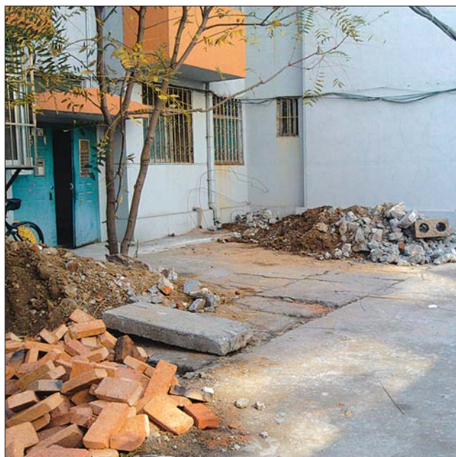
温泉路泰安市国土资源局宿舍户表改造正在进行。

缴费时间为2013年11月10日前,缴费标准2600元(多退少补),通知上还提供了缴费的银行账号、联系人和联系电话。住户交费后需告知联系人,逾期不交改造费用的用户视为自动放弃。通知落款是局办公室,盖着泰安市国土资源局办公室的公章。