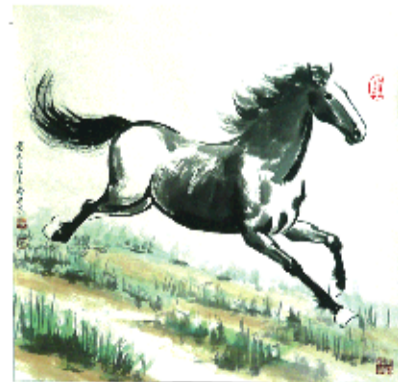
作品:《骏马图》 创作者:王子贵 规格:4平尺 润稿费20000元/平尺

纪念徐悲鸿诞辰120周年,徐悲鸿艺术委员会典藏巨作! 家藏悲鸿真迹,财富无可匹敌!三位嫡传大师升值潜力不可估量,抢到就是财富!