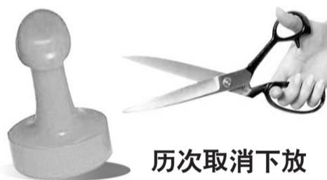
历次取消下放行政审批