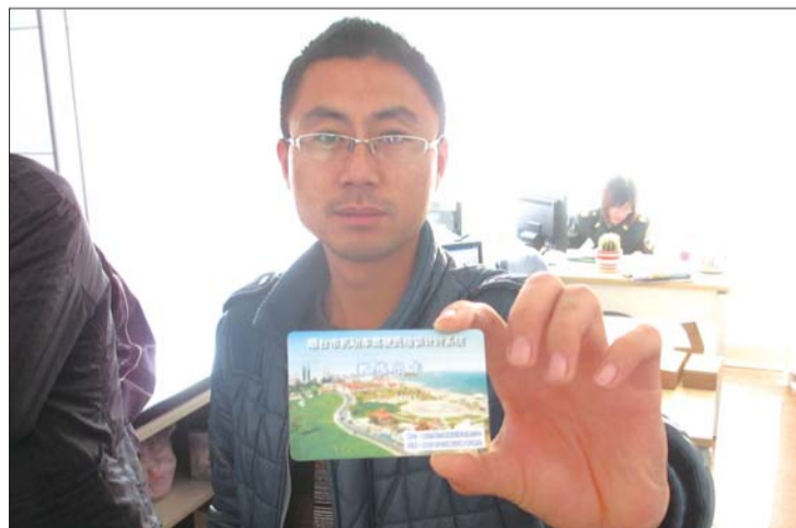
12日,在烟台市机动车驾驶员培训监管服务大厅内,有教练员前来办理IC卡。

“学员学得更扎实,教练员整体素质更高,‘马路杀手’会越来越少。”滨海驾校的杨校长向记者分析说,尽管年初的考试通过率一度下降30个百分点,但现阶段各驾校的考试通过率与往年基本持平,“考试难度加大通过率持平,说明学员的驾驶水平越来越高。”杨校长说。