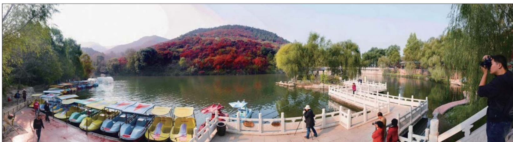
▲摄尽人间秋色。 作者:刘金柱