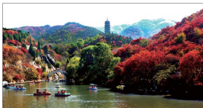
▲大美红叶谷。