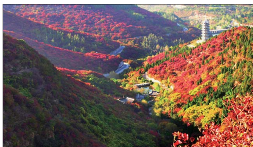
▲远眺红叶谷。 作者:陈洪波