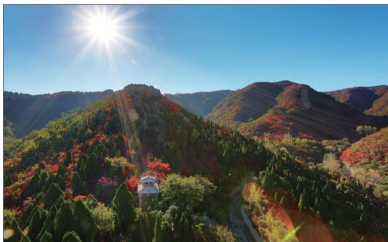
▲层林尽染。 作者:李金亭